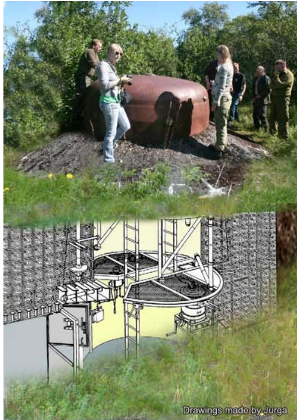
Fotomontasje/ Tegningen er laget av Jurga.