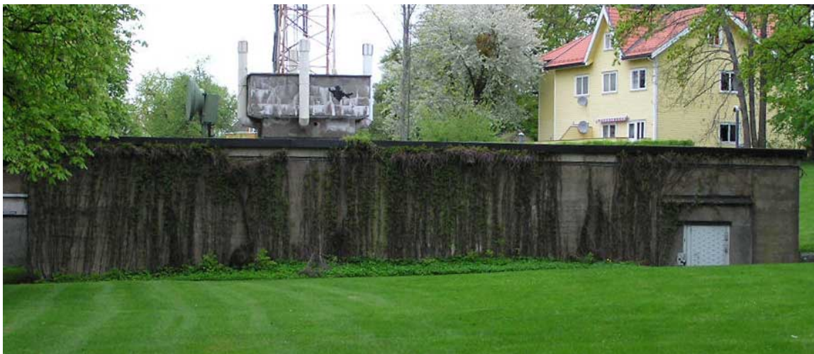
På Horten er det diskusjoner om å rive ned en av bunkere fra den andre verdenskrig. Les mer i denne artikkelen fra avisen Gjengangeren " varaordføreren vil rive Albert Speer-bunkeren "

Eiendommer som fra før har vært på militært område blir fortløpende lagt ut for salg og alle med kapital strømmer til for å overta. Områdene legges så ut som profitable boligområder og hyttetomter. Stadig oftere kan man lese om bunkere og kystfort som blir gravd ned eller revet for å gjøre plass til ny infrastruktur eller bebyggelse. Dette skjer gjerne langt ut i fjordene der hvor gamle kystfort står. I dag er hyttetomter i kystområder etterspurt, og det er mye penger å tjene. Reguleringer til boligtomter skjer hurtig og eventuelle installasjoner fra krigen blir enkelt strøket fra kartet med rød pen uten at noen rekker å reagere.