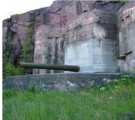
Kystfort ved Bolærne

Denne artikkelen omhandler litt av problematikken med å bevare tyske installasjoner fra krigen. Med tanke på vår lange historie her i Norge er ikke seksti år noe lang tid, men vi er nødt til å handle hvis det skal være noe igjen av restene etter denne krigshistorien. Selv om forsvaret offisielt går ut med at de ønsker å bevare de krigshistoriske anleggene, så gjelder det egentlig bare de større festninger. Mindre kystfort og ensomme bunkere seiler sin egen sjø og frigis fortløpende til sivilt område. Tyske anlegg har således lav status som kulturminner.