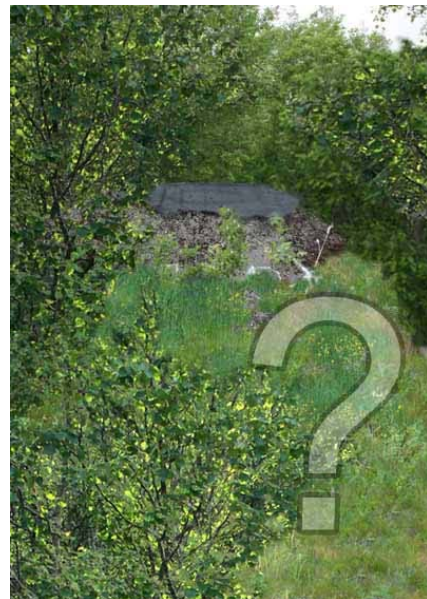
Ville vi være like interessert i historien hvis elementene fra tidsperioden var godt tapt? Fotomontasje