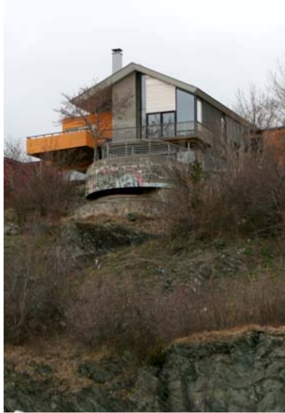
Bebyggelsen spiser seg inn på tidligere militære områder. Umulig å stoppe, men heldigvis blir ikke alle bunkere revet når huset skal bygges.

Da krigen var over i Europa, ble nesten alle slike gjenstander revet ned på grunn av stort behov for jern. Det finns bare 8-9 slike store bunkere som ennå har kuppelen i behold. Kan hende denne bunkeren ble glemt etter krigen, eller kanskje hadde man ikke nødvendig utstyr for å dele den opp. Uansett ble denne og to andre bunkere i dette området gravd over. Bunkeren ble igjen "oppdaget" av bunkerjegere og fikk bra med spalteplass i den lokale avisa. Det var svært få som kunne si at de visste om denne spesielle bunkeren da den er utenfor allfarsvei.