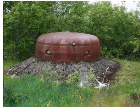
Bunkeren er av type R633. Denne er en av de siste i Europa som ennå har kuppelen intakt.