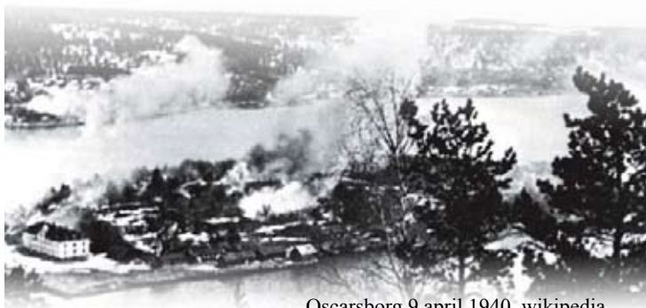
Oscarsborg 9 april 1940, wikipedia