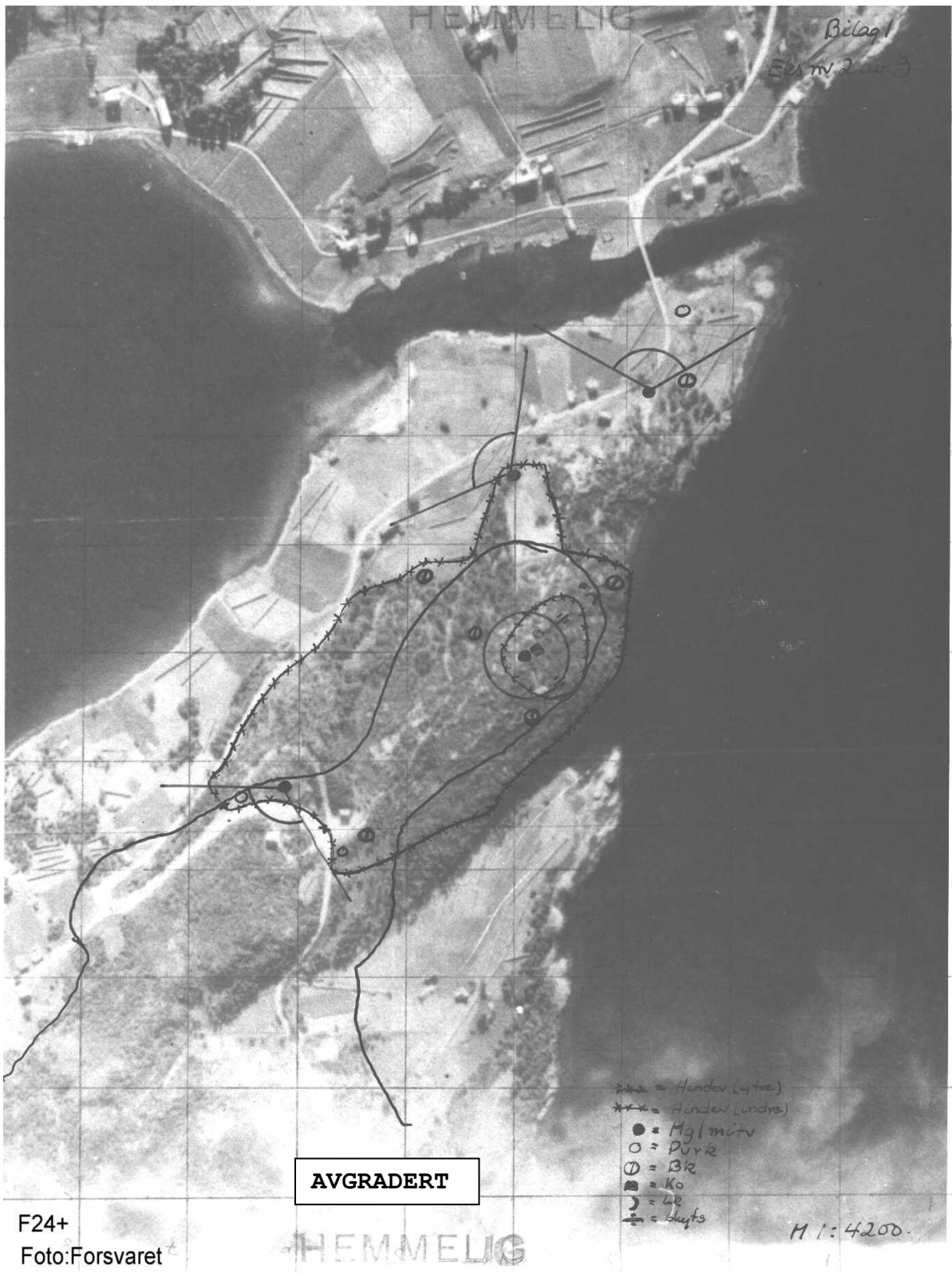
Flyfoto Straumen batteri.