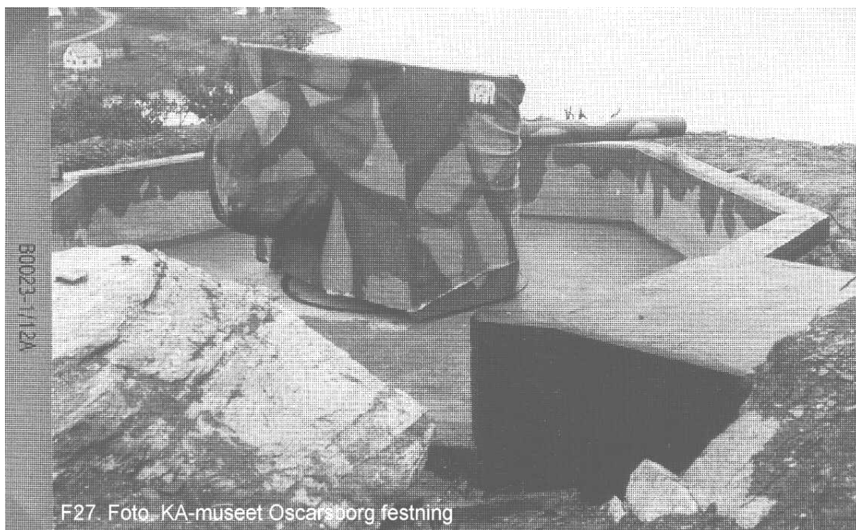
Kanon ved Straumen batteri.

I følge skuddlistebøkene er det ikke løsnet skudd med kanonene.